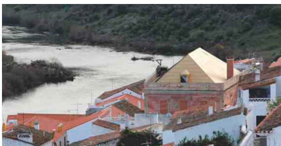
Reabilitação e refuncionalização da Casa Cor de Rosa em Mértola