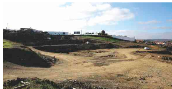
Lar das 5 Freguesias, em S. Miguel do Pinheiro