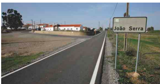
Saneamento e pavimentação em João Serra