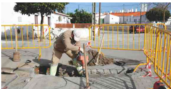
Requalificação da zona junto ao Mercado na Mina de S. Domingos