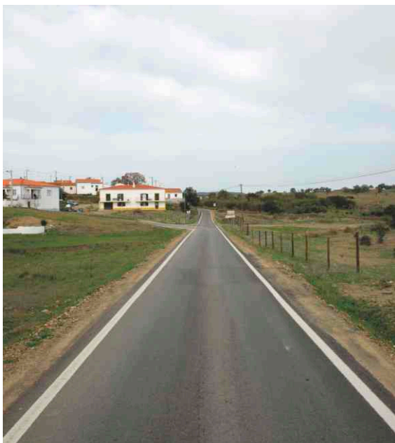
Obras de conservação na estrada dos Namorados-João Serra