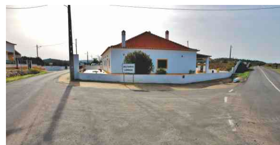
Saneamento e pavimentação em Alcaria Longa