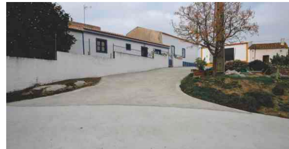
Pavimentação em Besteiros