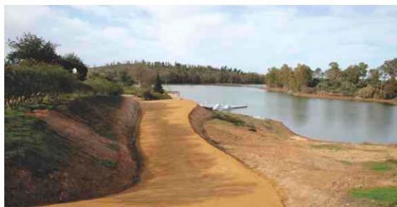
Execução de Rampa de Acesso a Pessoas com Mobilidade Condicionada na Praia Fluvial da Mina