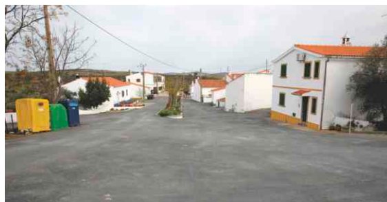
Pavimentação em Sapos - Mértola