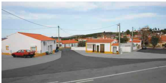
Pavimentação e arruamentos em S. João dos Caldeireiros