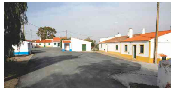
Pavimentação em Bicada