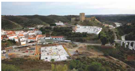
Novo espaço Expo Mértola