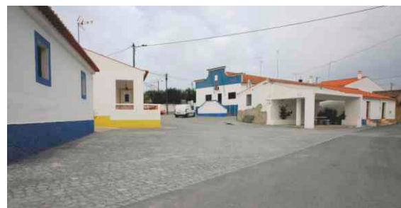
Requalificação do Largo em Corte Gafo de Baixo