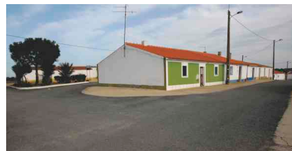
Pavimentação em Vale Camelos