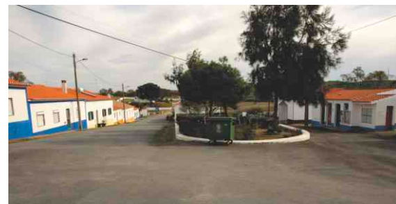
Pavimentação em Ledo