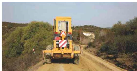
Reparação da estrada de terra batida para Água Santa da Herdade