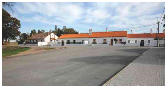
Pavimentação de troço de rua na Mina junto ao Centro Republicano