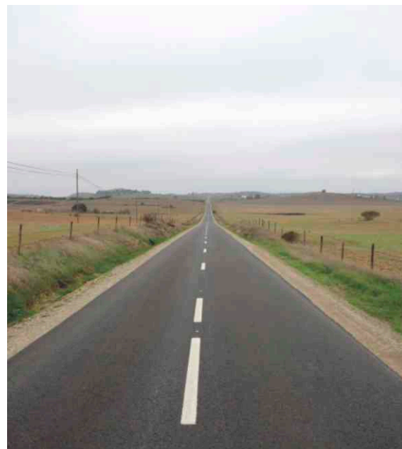
Obras de conservação na EM 506 em S. Pedro de Sólis