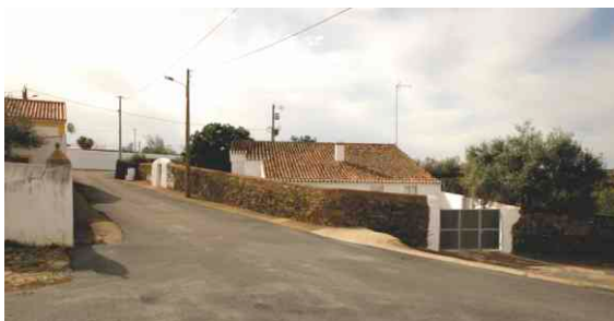
Pavimentação em Salgueiros