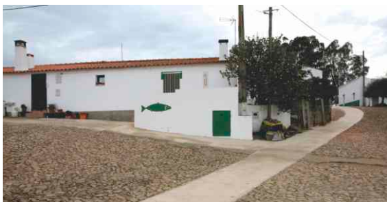
Execução de passadeira para acesso a pessoas com mobilidade condicionada em Mosteiro