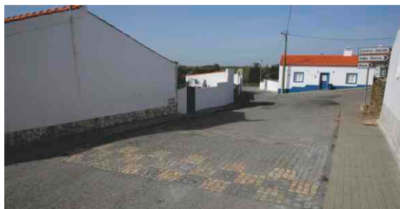
Reabilitação de Pavimentos e Reparação de Passadeiras em Penilhos