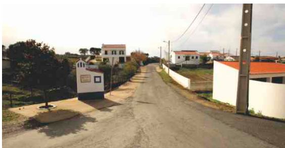
Saneamento e Pavimentação em Picoitos