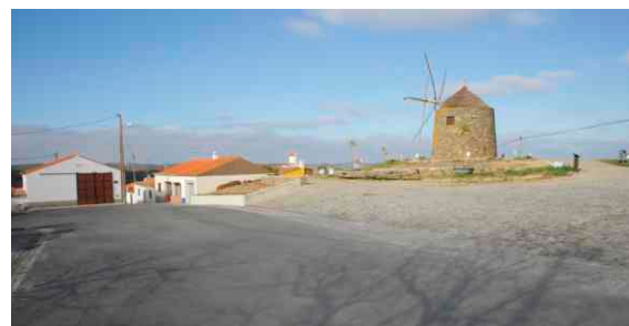
Rede de água e pavimentação em S. Miguel do Pinheiro