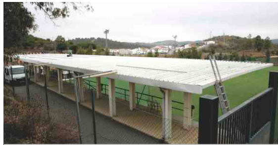
Montagem Painéis Fotovoltaicos Campo de Futebol em Mértola