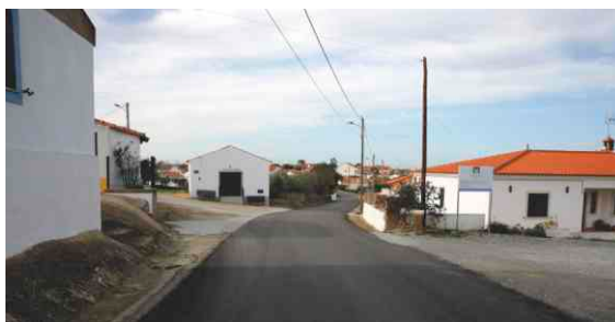
Rede de água em S. Pedro de Sólis