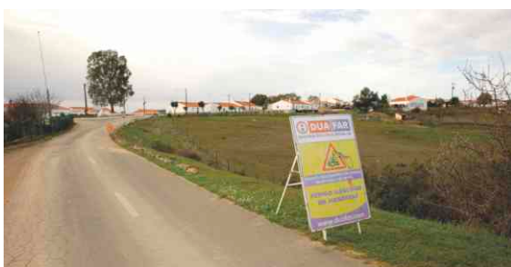
Saneamento e pavimentação em Montes Altos