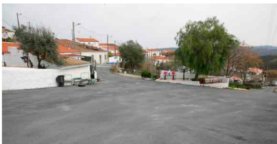
Pavimentação em Mesquita