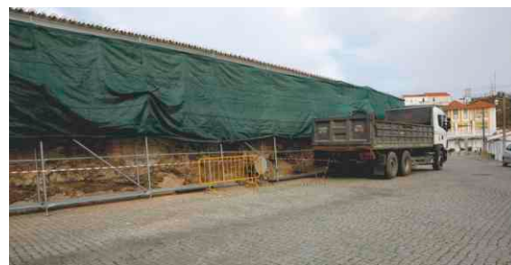
Recuperação do edifício dos antigos bombeiros em Mértola