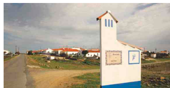
Saneamento e pavimentação em Alves