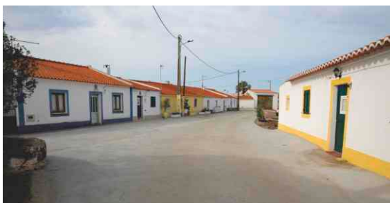
Pavimentação em Corte Cobres