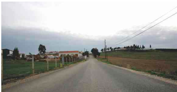
Pavimentação em Alcaria Ruiva