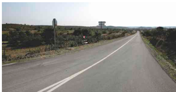
Obras de conservação na estrada de Alcaria Longa - EN 267