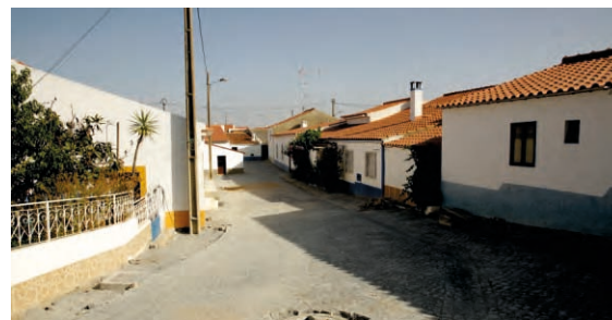
Rede de Água e Pavimentação São Miguel do Pinheiro