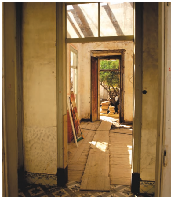
Casa Cor de Rosa Mértola