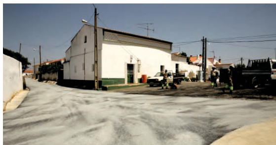
Arruamentos Amendoira da Serra