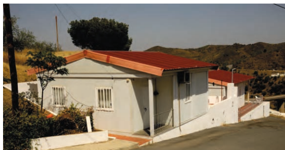
Cobertura em Pré-Fabricado Mértola