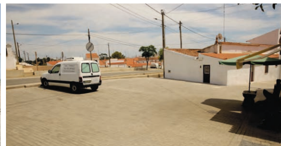
Pavimentação junto ao Café Milénio Mina de São Domingos