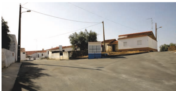
Arruamentos Monte Góis