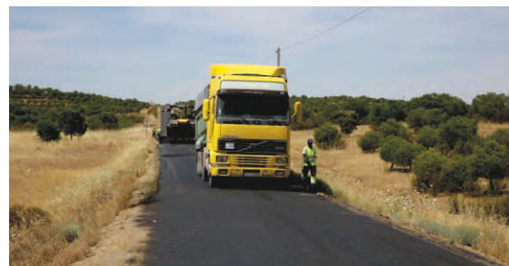
Pavimentação Estrada Municipal 506 | EN 122 São Pedro de Sólis