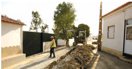
Rede de Água São Pedro de Sólis