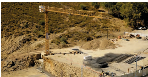
Expo Mértola Mértola