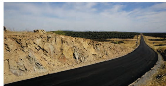
Estrada EN122 S. Pedro de Sólis