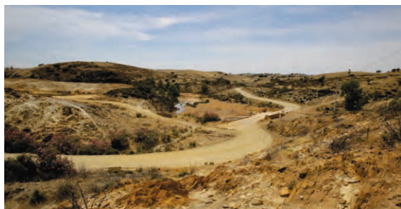
Arranjos na Estrada de Terra Batida Santana de Cambas | Montes Altos