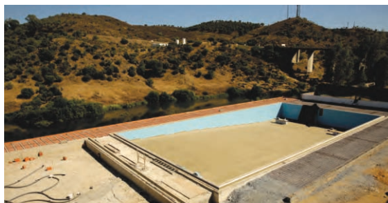
Piscinas Municipais Mértola