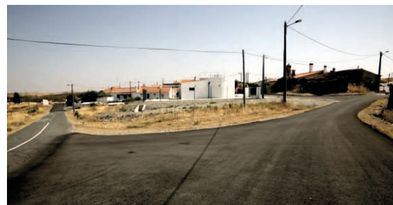
Saneamento e Pavimentação João Serra