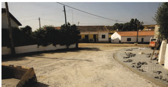
Arruamentos São João dos Caldeireiros