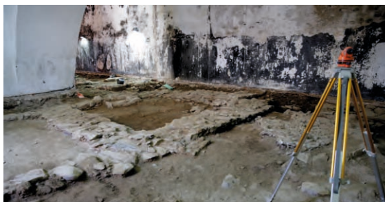
Casa Cor de Rosa Mértola