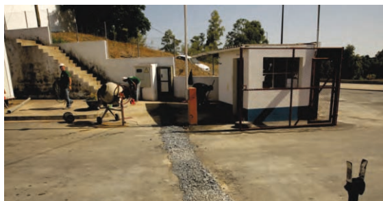
Intervenção no Estaleiro Municipal | Mértola