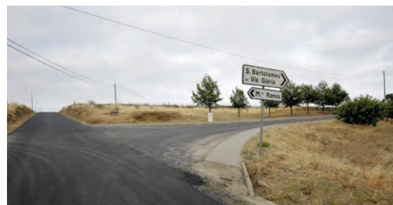
Alteração Funcional ao Triângulo na Estrada Via Glória