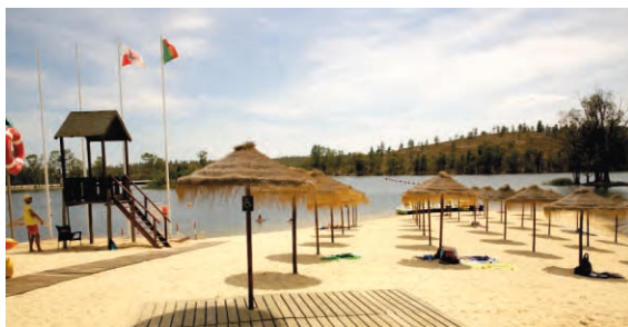
Novos Chapéus de Sol Mina de São Domingos