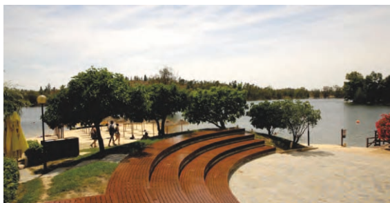
Arranjos no Anfiteatro Mina de São Domingos