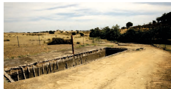
Limpeza da ETAR Corte do Pinto