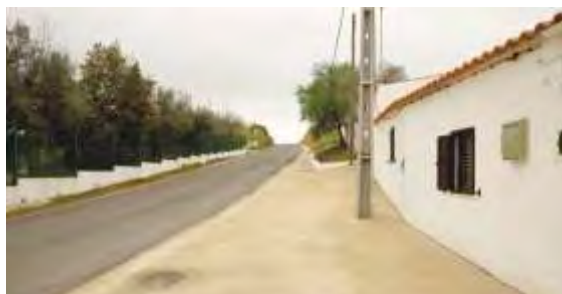
Melhorias na Entrada da Localidade Corte do Pinto