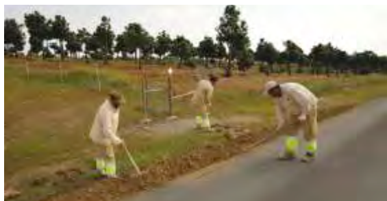
Arranjo de Bermas Estrada dos Namorados