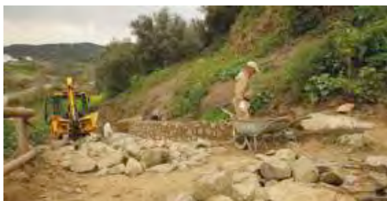
Percurso Ribeirinho Mértola