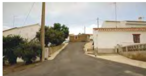
Pavimentos Monte Góis