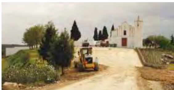
Pavimentação de Arruamentos São João dos Caldeireiros