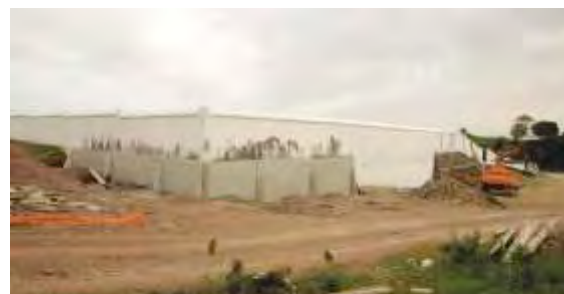
Reforço de Muros do Cemitério Mértola