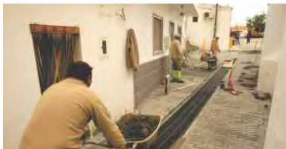
Arruamentos Mina de São Domingos