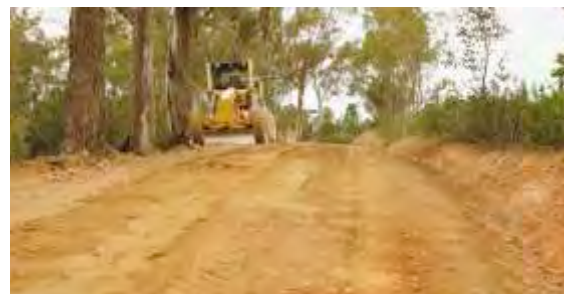
Arranjos na Estrada de Terra Batida Entre Corte Sines e Vale Côvo