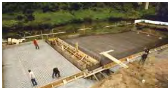
Piscina Municipal Mértola