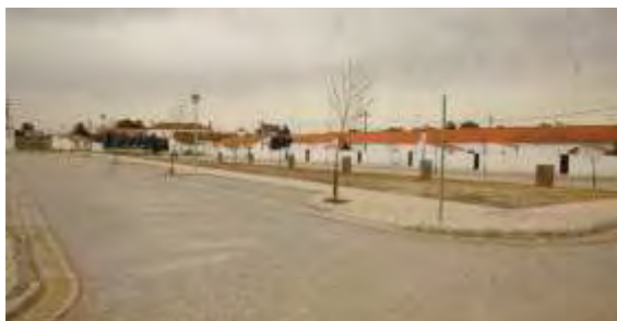
Zona de Expansão Urbana Mina de São Domingos