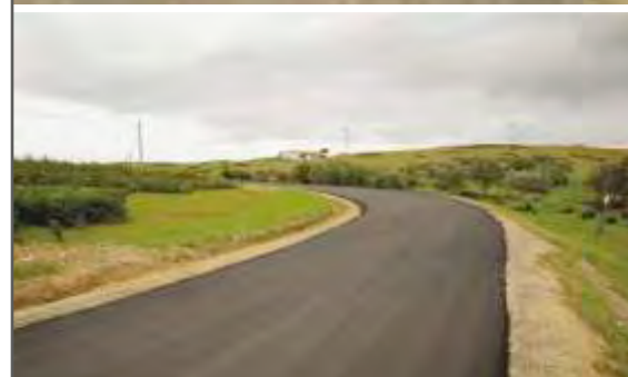
Rede de Água e Pavimentação São Miguel do Pinheiro