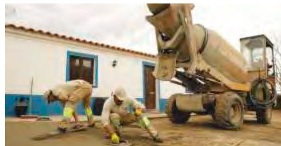
Arruamentos Vale do Antoninho