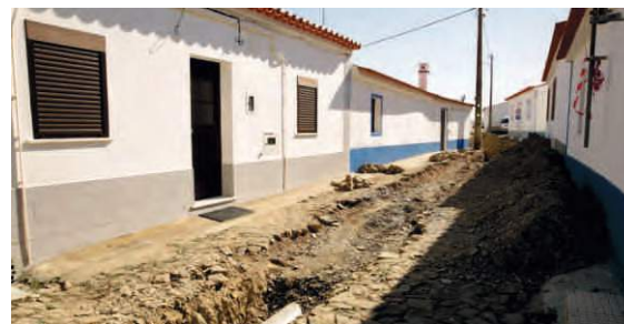
Drenagem de Águas Pluviais Bens