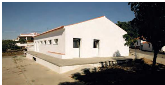
Arranjos exteriores na sede da Junta de Freguesia Santana de Cambas