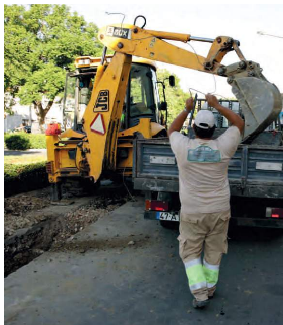
Coletor de Esgoto Mértola