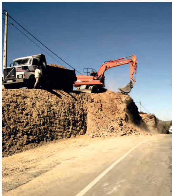
Remodelação da Entrada Corte do Pinto