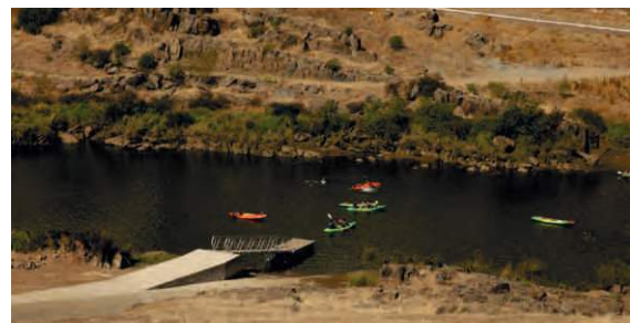
Construção de rampa de acesso a plataforma Rio Guadiana | Mértola