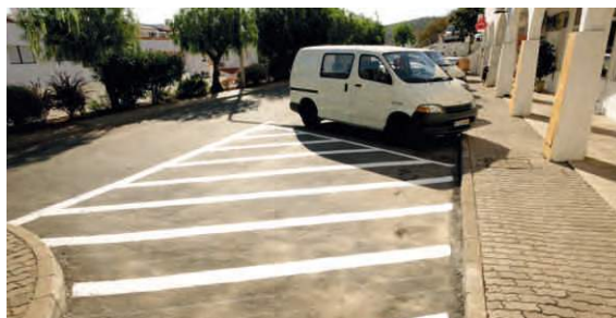
Organização do estacionamento Praceta das Lojas | Mértola