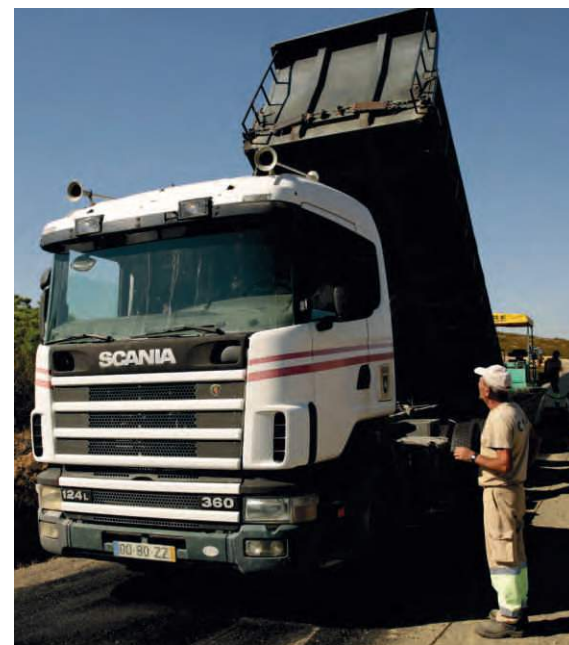
Repavimentação da estrada João Serra - Namorados