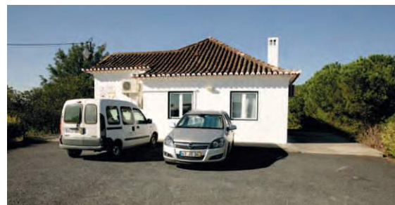
Requalificação da Casa da Floresta Mértola