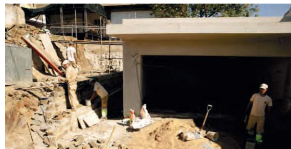
Ampliação da Casa Mortuária Mértola