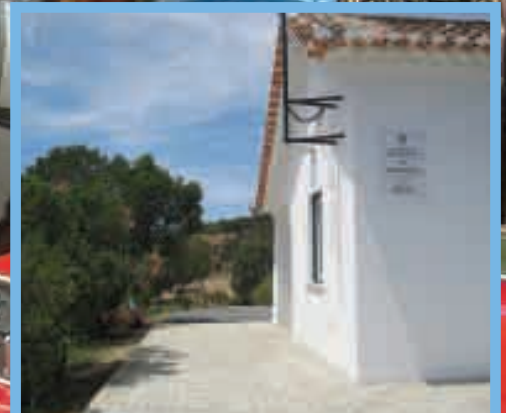
CASA DO AMBIENTE Pág.11