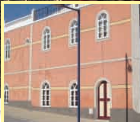
NINHO DE EMPRESAS Pág.2