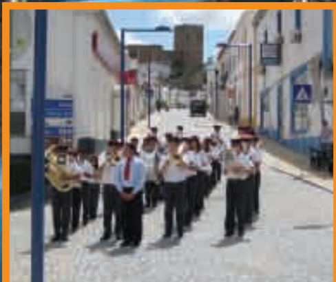
EIXO COMERCIAL Pág.3