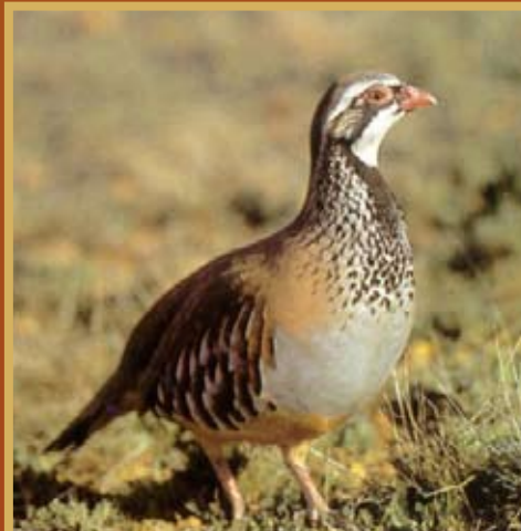
1ª FEIRA DA CAÇA DE MÉRTOLA