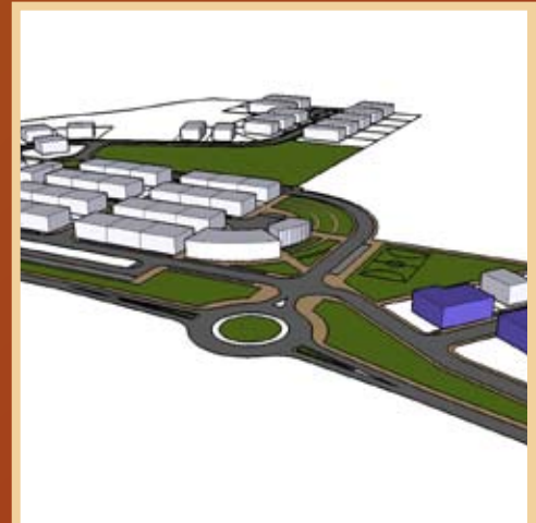
NOVA ZONA INDUSTRIAL E LOGÍSTICA