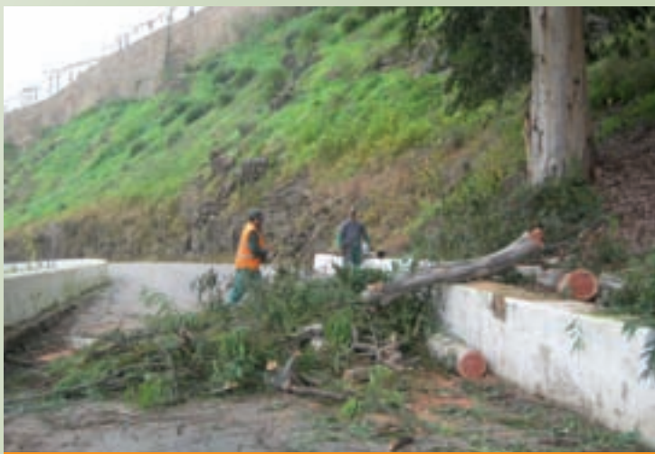
Corte de eucaliptos em Mértola