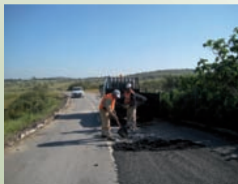
Pavimentação da estrada Montes Altos – Mina de S. Domingos