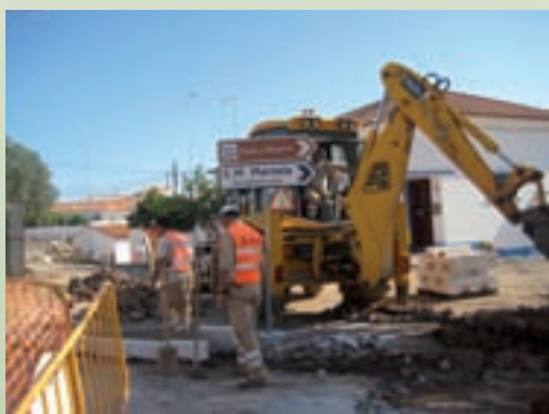
Pavimentação na Mina de S. Domingos