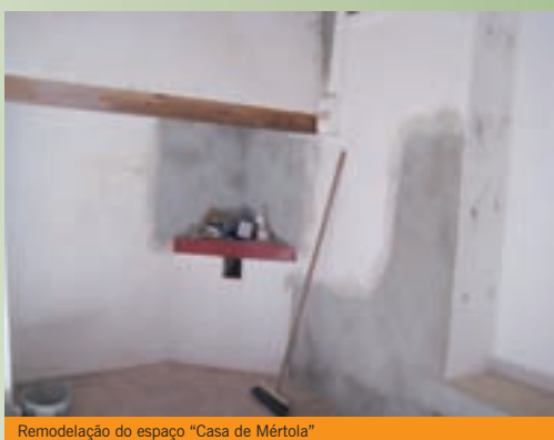
Remodelação do espaço "Casa de Mértola"