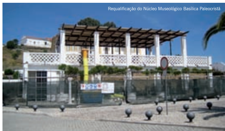
Requalificação do Núcleo Museológico Basílica Paleocristã