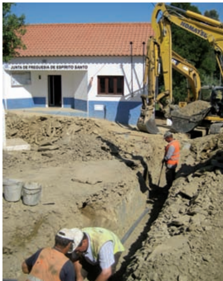
Saneamento e pavimentação em Espírito Santo