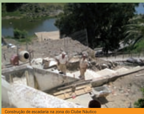
Construção de escadaria na zona do Clube Náutico