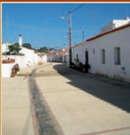
A NOVA FACE DA MINA DE S. DOMINGOS

Câmara de Mértola entre as melhores nas contas