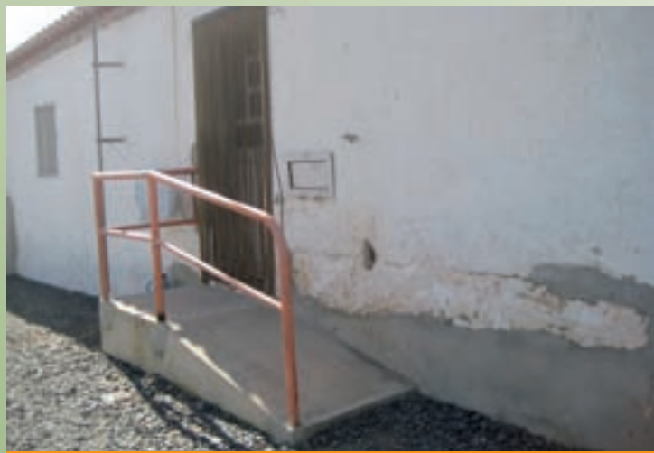
Construção de rampa de acesso na Mina de S. Domingos