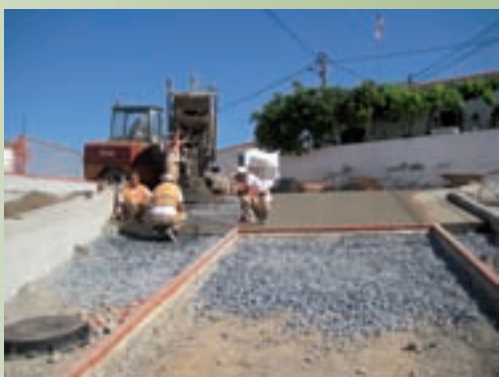
Pavimentação na Mina de S. Domingos