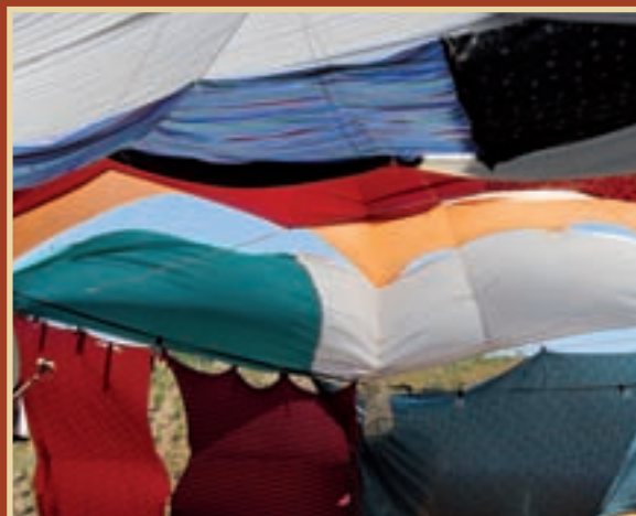
6.º FESTIVAL ISLÂMICO DE MÉRTOLA