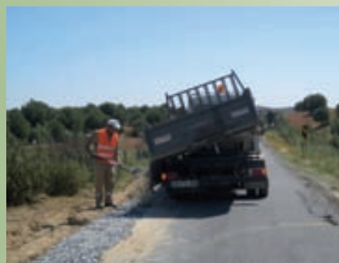
Diversos remendos em cola nas estradas