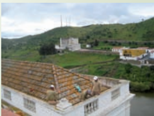
Arranjo de telhados e colocação de rede de protecção