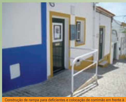
Construção de rampa para deficientes e colocação de corrimão em frente à porta da casa de Artes Mário Elias