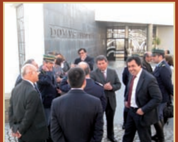
GNR FICA EM MÉRTOLA