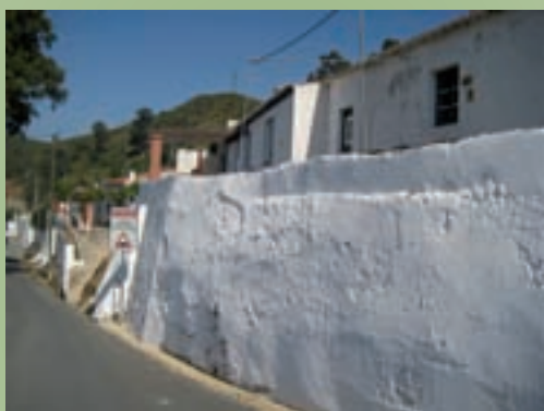
Caição de muros no Pomarão