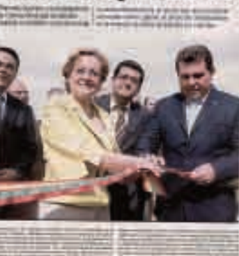
La Opinión (Jornal espanhol 27/02/2009)