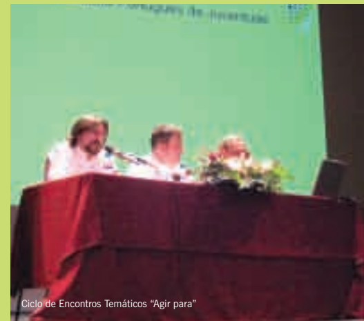
Ciclo de Encontros Temáticos “Agir para”