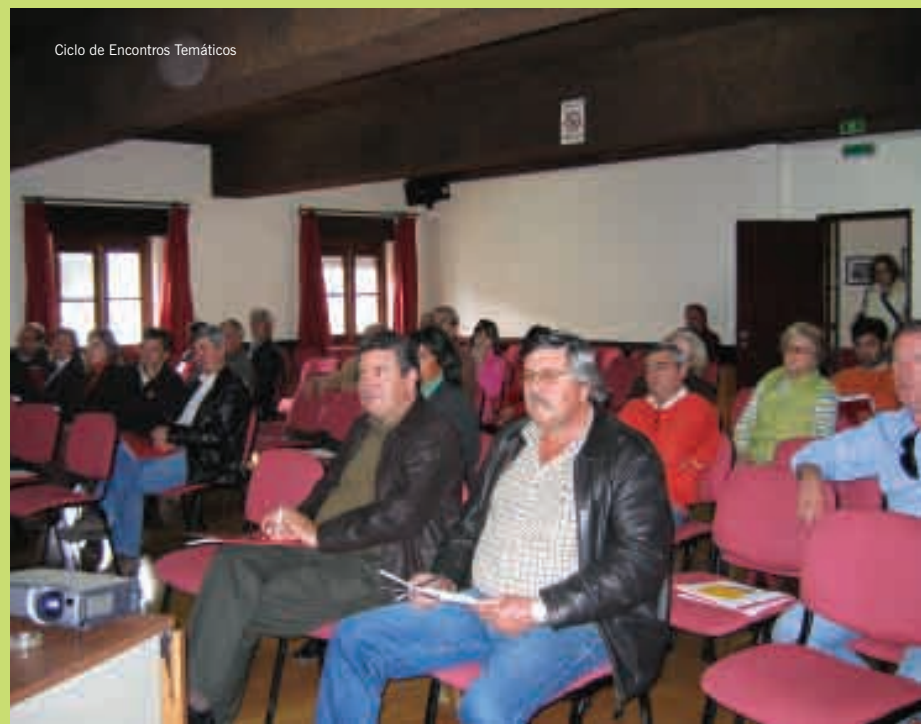
Ciclo de Encontros Temáticos