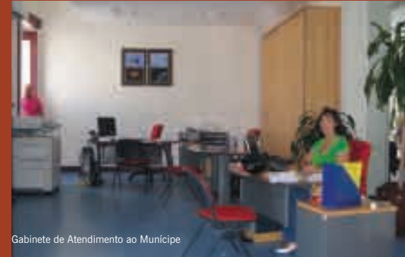
Gabinete de Atendimento ao Município