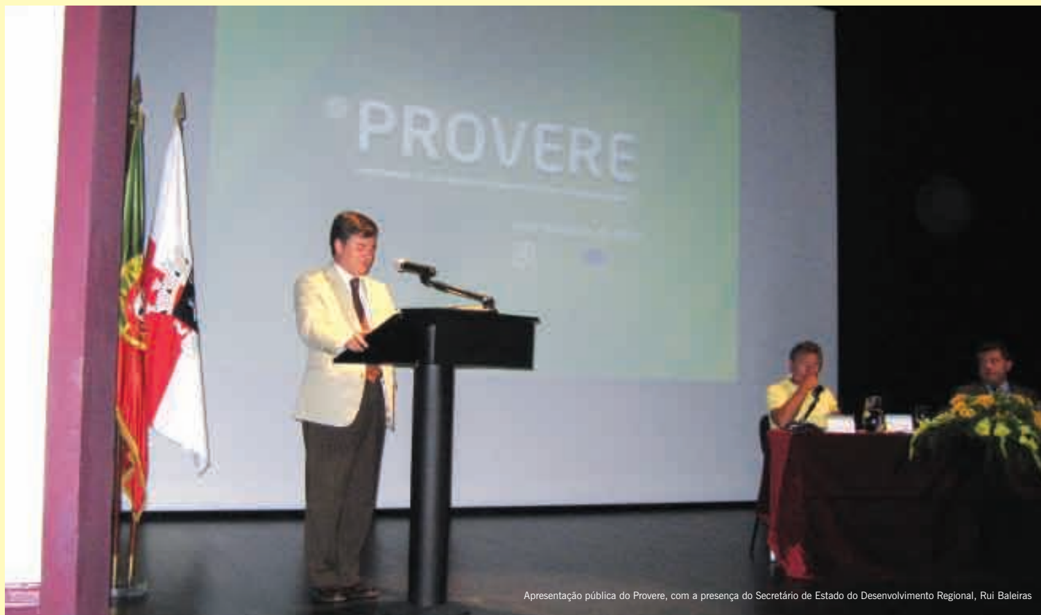
Apresentação pública do Provere, com a presença do Secretário de Estado do Desenvolvimento Regional, Rui Baleiras

O investimento total associado ao “PROVERE – Âncoras do Guadiana” ascende a cerca de 60 milhões de euros e envolve o co-financiamento de 5 programas operacionais: P.O. Algarve, P.O. Alentejo, PRODER – Subprograma 3, P.O. Valorização do Território e P.O. Potencial Humano.