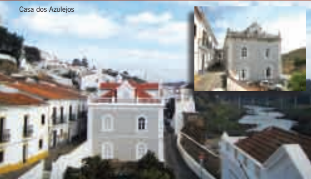
Casa dos Azulejos

No âmbito da modernização administrativa a Câmara Municipal de Mértola assinou o protocolo de adesão ao Simplex Autárquico, cujo objectivo é melhorar ainda mais os serviços prestados à comunidade. Com entrada em vigor deste sistema será possível certidões na hora, entre outros serviços, alguns dos quais já disponíveis em www.cm-mertola.pt , como é o caso de formulários electrónicos.