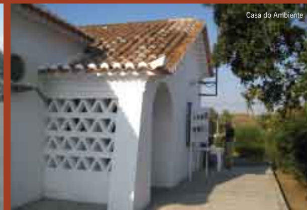
Casa do Ambiente