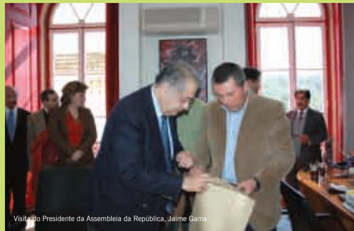
Visita do Presidente da Assembleia da República, Jaime Gama