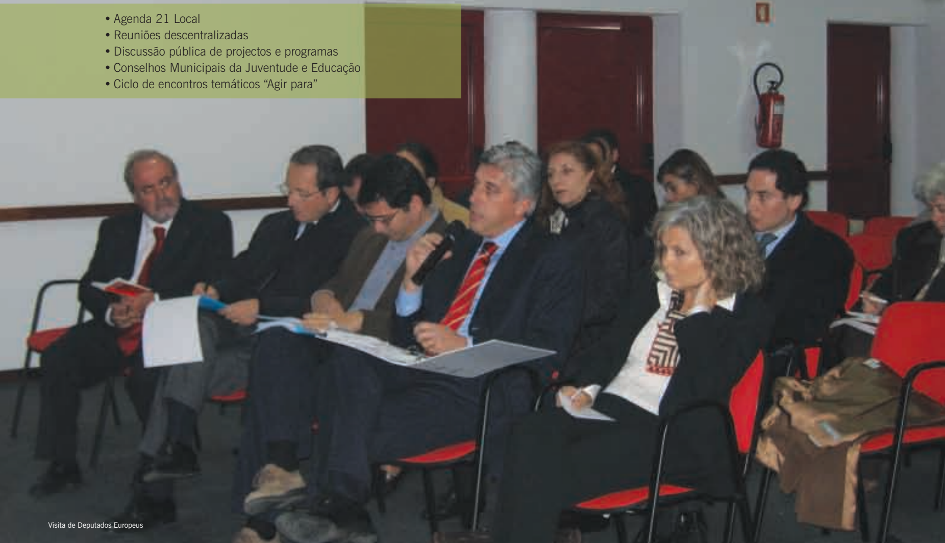
Visita de Deputados Europeus