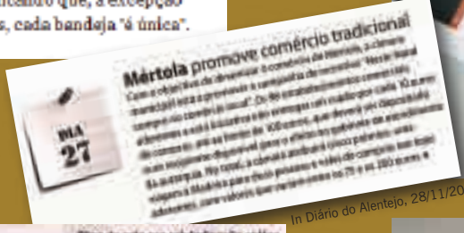
In Diário do Alentejo, 28/11/2008