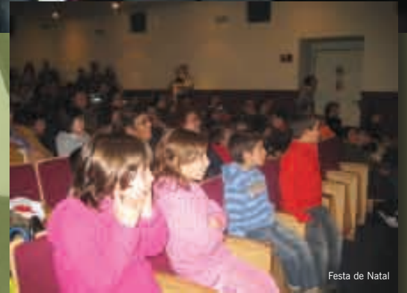
Festa de Natal