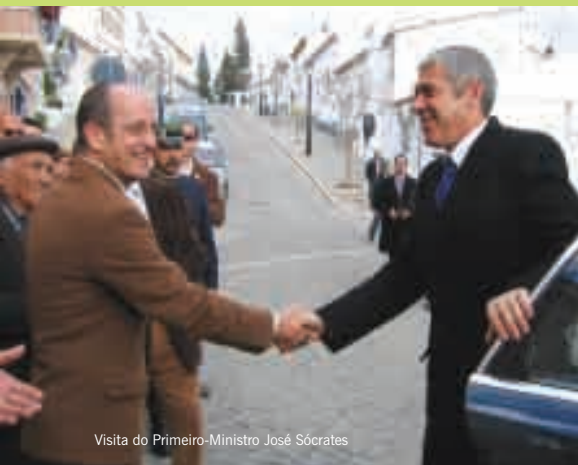
Visita do Primeiro-Ministro José Sócrates