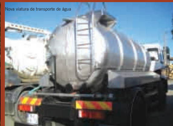
Nova viatura de transporte de água