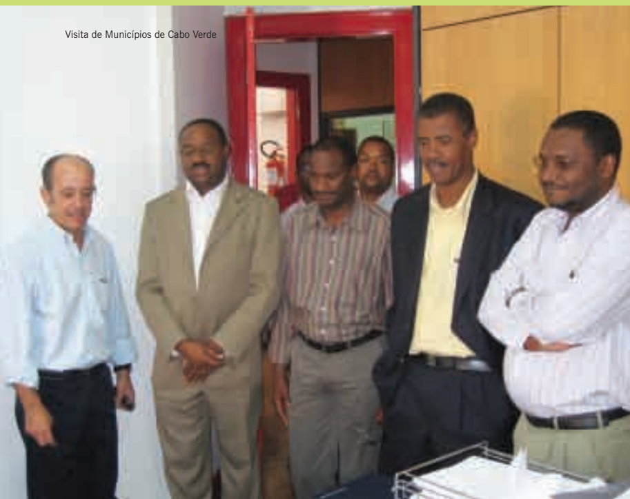
Visita de Municípios de Cabo Verde