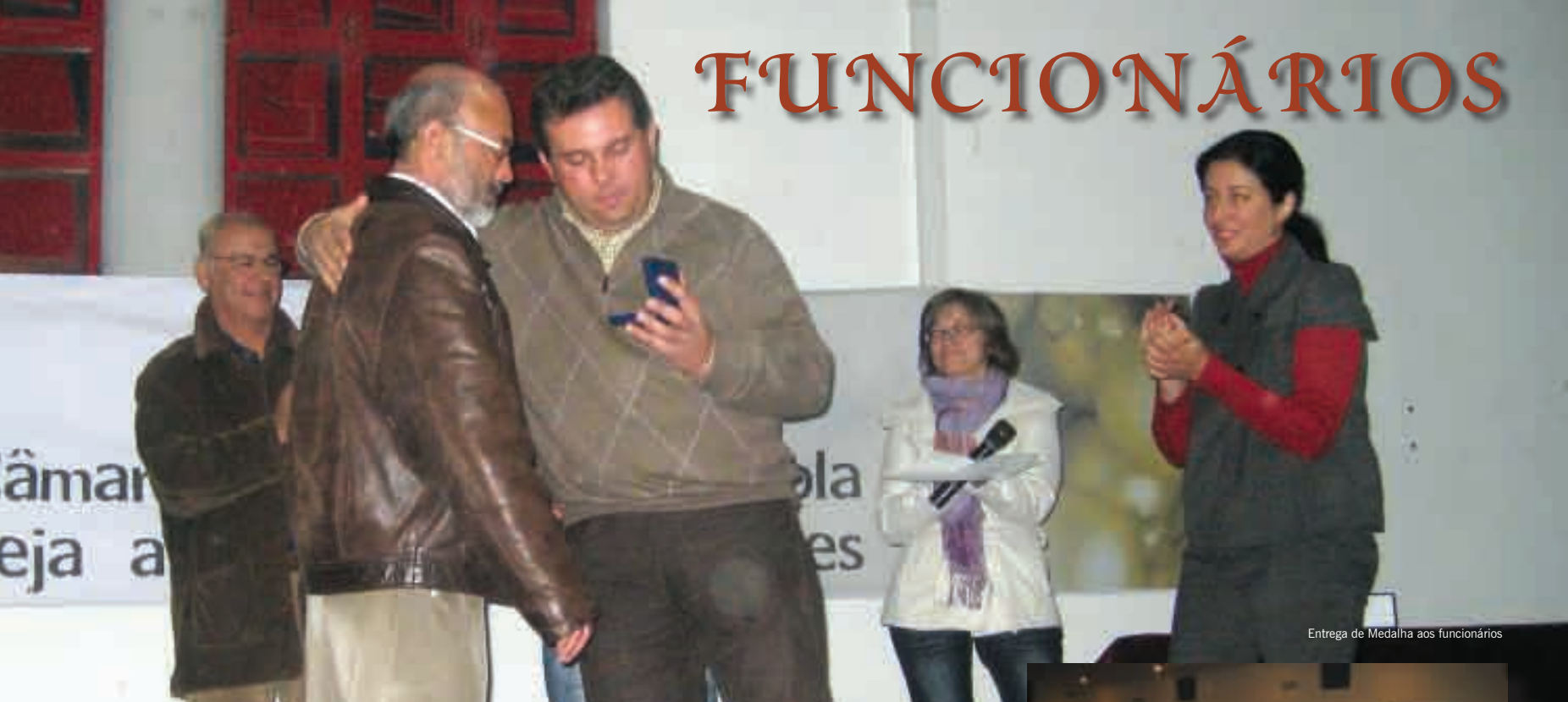
Entrega de Medalha aos funcionários