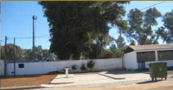
Estação de autocaravanas // Mina de S. Domingos