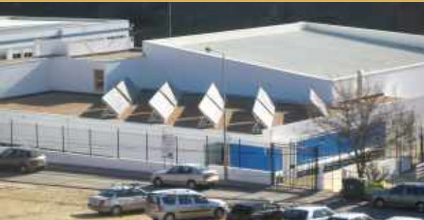
Colocação de painéis solares Piscina Municipal // Mértola