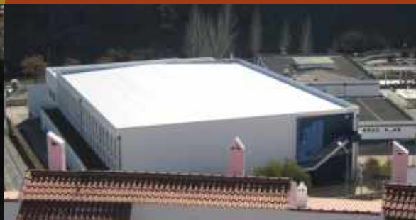
Remodelação da cobertura do Pavilhão Desportivo Municipal // Mértola