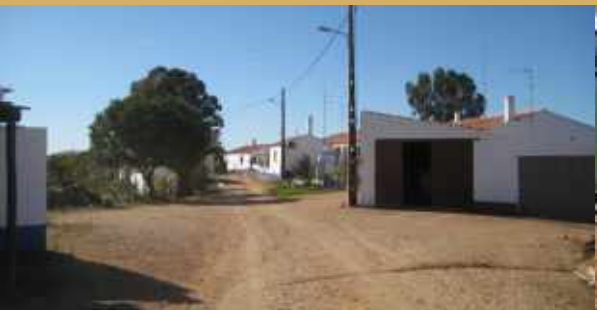
Pavimentação // Vale Pereiro da Serra