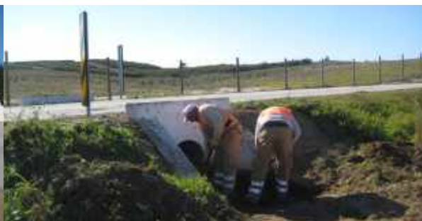
Limpeza de valetas // Estrada entre Alcaria dos Javazes e Espírito Santo