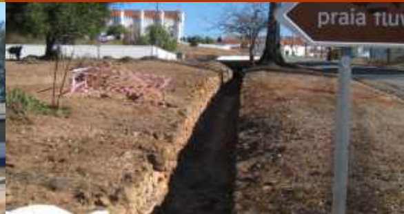
Coletor pluvial // Mina de S. Domingos