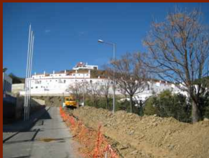
Construção de coletor pluvial junto do novo loteamento // Mértola