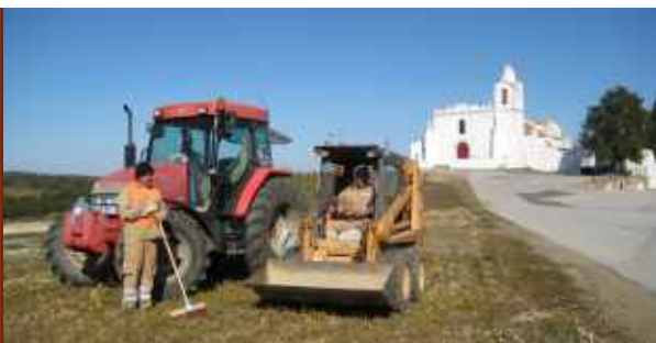
Limpeza de Bermas // Espírito Santo