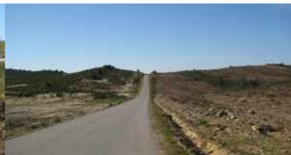
Limpeza de valetas // Estrada de acesso à Mesquita