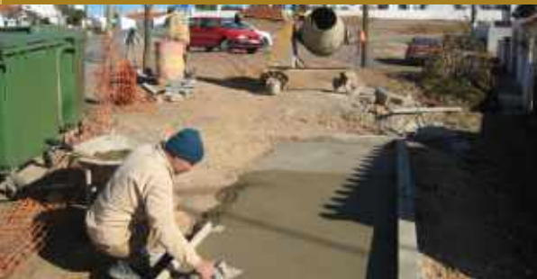
Construção de bases para contentores // Mina de S. Domingos