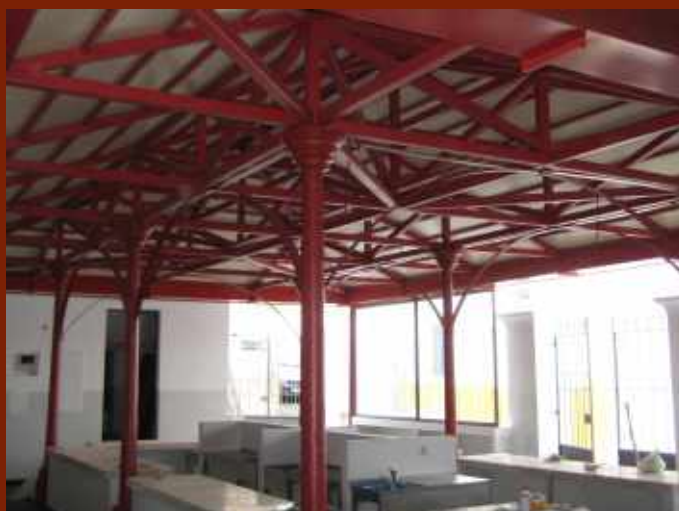
Mercado Municipal // Mértola