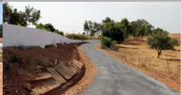
Ramal em Vale do Poço