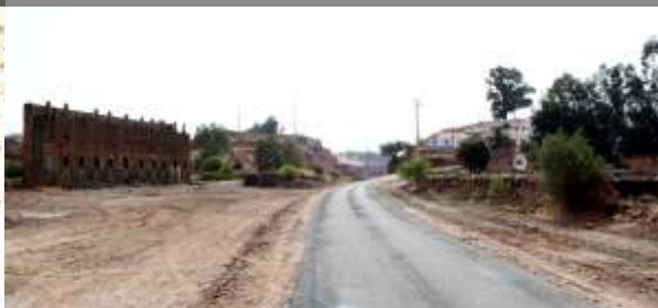
Arruamento de ligação ao Largo do Hospital na Mina S. Domingos