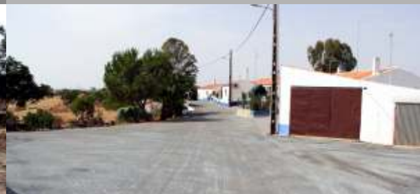
Arruamentos em Monte Vale Pereiro da Serra