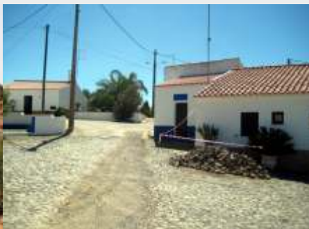
Obras de saneamento em S. Sebastião dos Carros