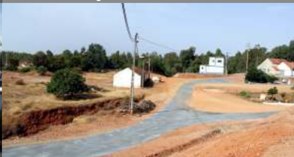
Arruamento de ligação à Rua dos Quartéis Dobles na Mina S. Domingos