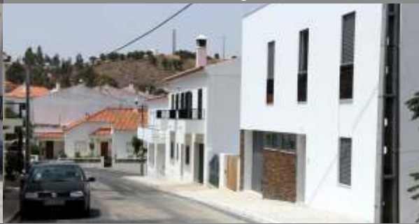
Passeio no loteamento da Rua Soeiro Pereira Gomes