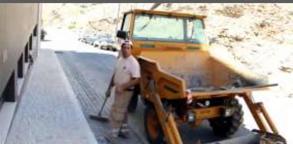
Passeio junto à Beira Rio em Mértola