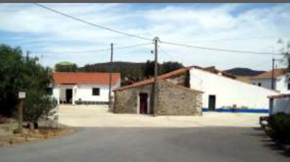
Pavimentação de arruamentos nas Romeiras