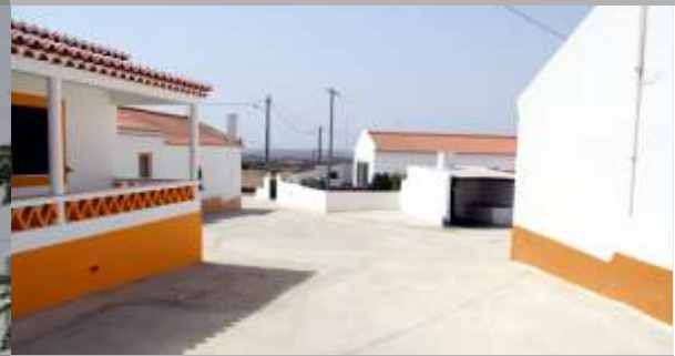
Conclusão da pavimentação do Monte dos Alves