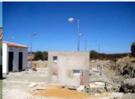
Etar de S. Sebastião dos Carros