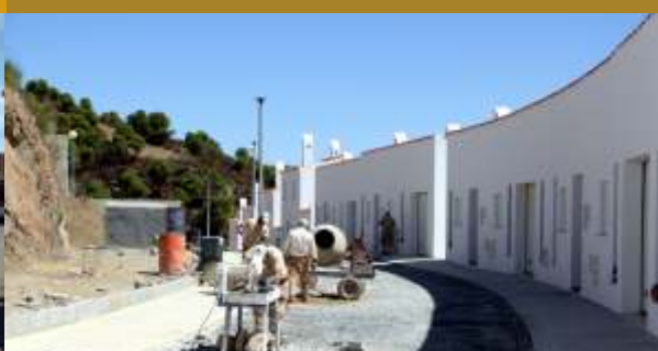
Conclusão da pavimentação no loteamento da Encosta Noroeste