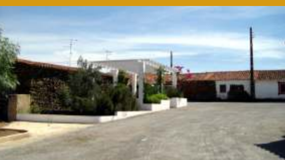
Arruamento em Lombardos