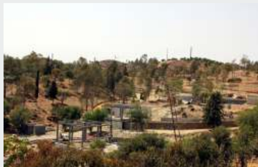
Parque Desportivo e de Lazer Municipal