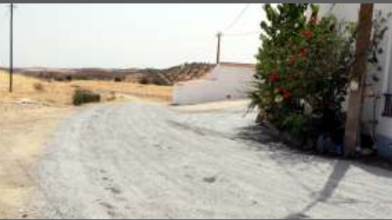
Asfaltamento em Boisões