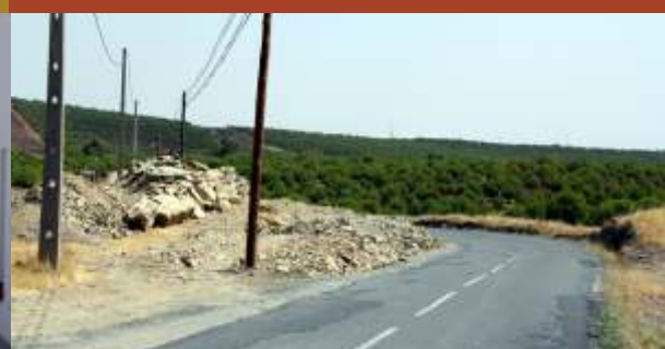
Corte de curvas no ramal dos Fernandes